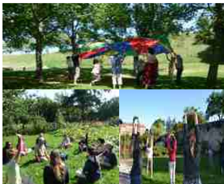
Journées d'été – août 2014

Placées sous le signe du dynamisme, de la bonne humeur et de la bienveillance, notamment grâce à un cadre verdoyant et reposant, elles furent l'occasion d'échanger sur des situations, des ressources, des techniques et des outils.