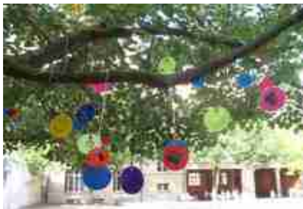
Quinzaine 2014-2017 « Je déclare la paix »

En 2013, la Quinzaine proposait aux établissements des activités s'inspirant du théâtre de l'opprimé dont l'une des grandes figures est Augusto Boal. Elle proposait aux enseignants, éducateurs et animateurs de réaliser avec les enfants des saynètes dans l'esprit du théâtre-forum.