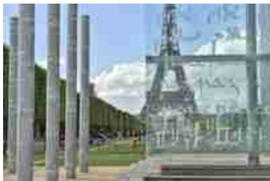
Mur de la Paix à Paris

De 2012 à 2015, la Coordination s'engage dans un nouveau partenariat européen : Discovering Peace in Europe, dont l'objectif est de créer et de promouvoir des parcours de paix autour de la non-violence et de la paix dans différentes villes européennes. Le partenariat inclut l'Universität für Angewandte Kunst (Autriche), l'association Konfliktkultur (Autriche), l'International Network of Museums for Peace (Pays-Bas), le Movimento Internazionale della Riconciliazione (MIR Italie), l'association Vitakultura Egyesület (Hongrie), le Manchester City Council, Nuclear Free Local Authorities (Royaume-Uni) et la Paulo Freire Gemeinnützige Gesellschaft (Allemagne).