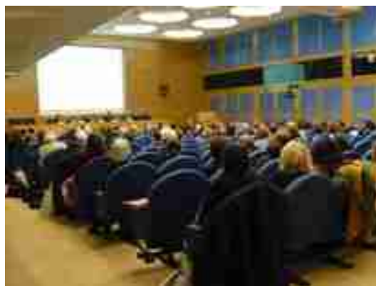
7 e Forum « La non-violence à l'école », Paris, Palais du Luxembourg, 2009

2014 : 12 e Forum - « Je déclare la paix : Pourquoi? Comment ? »