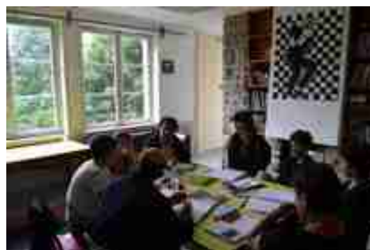
Journées d'été – août 2012

Dans un esprit de dynamisme et d'échange, la Coordination a mis en place depuis 2011 ses Journées d'été. Ces Journées sont organisées pendant le mois d'août, durant une semaine. En alternant entre interventions de spécialistes, sessions plénières et ateliers en petits groupes, elles permettent aux participants d'échanger réflexions et pratiques autour de l'éducation à la non-violence et à la paix.