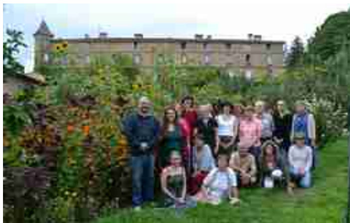
Journées d'été – août 2014

Des axes de réflexion sont privilégiés et mis en place par la Commission de Journées d'été. En 2011, les thèmes retenus étaient ceux de la coéducation parents/enseignants et de l'évaluation des formations. En 2012, le thème était le suivant : « l'éducation à la non-violence et à la paix : Pourquoi ? Comment ? ». En 2013, le sujet était « S'exercer à l'éducation à la non-violence et à la paix : repères théoriques et construction d'outils ».